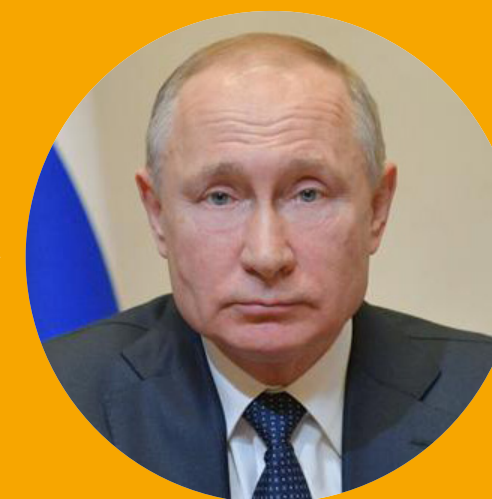
Владимир Владимирович Путин